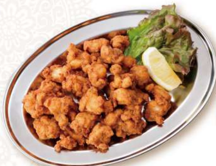
27 軟骨唐揚げ Cartilage Fried Chicken 750円 軟骨のコリコリ感がやみつきになる！