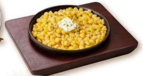
30 バターコーン Butter Corn 600円 コーンにスパイスを加え、鉄板でジュージューお出しする一品。