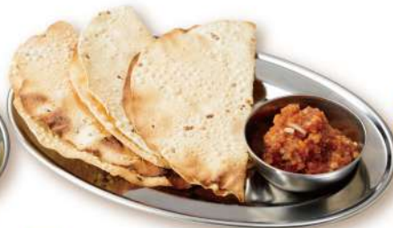
24 パパド Papad 380円 豆の粉で作ったパリッパリのインドせんべい。おつまみにピッタリ。