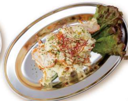
29 ポテトサラダ Potato Salad 680円 新感覚なタンドリーチキンポテトサラダ。