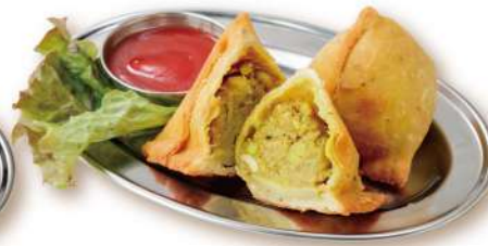
25 サモサ Samosa 2pcs 700円 ジャガイモを生地で包み揚げたインド定番の snacks。ちょっぴりスパイシー。