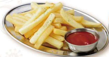
23 ポテトフライ Potato Fry 580円 サイドメニューの王道！