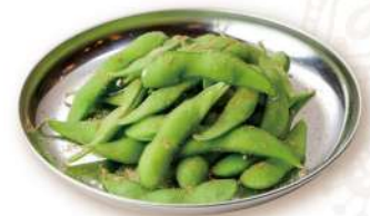
26 枝豆 Green Soy Beans 580円 ビールの定番。おつまみにどうぞ。