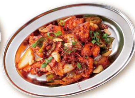
28 チリチキン Chili Chicken 880円 鶏肉と野菜をスパイシーなトマトソースで炒めた“インド中華”の定番です。